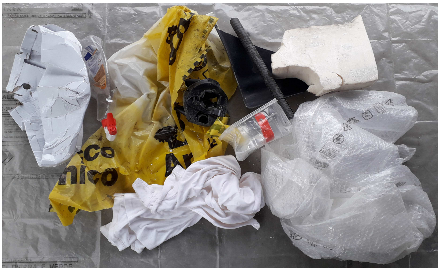
CAMPIONE MEDIO COMPOSITO